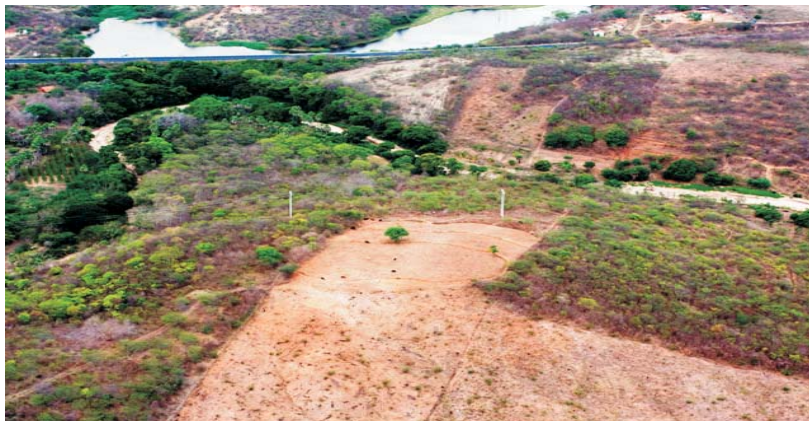
Foto 1 – Fragmento de Mata Ciliar e Áreas Adjacentes Desflorestadas – MBH do Rio Cangati