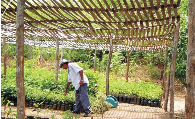
Foto 3 – Agricultor Manejando o Viveiro de Mudanças de Essências Nativas

Quanto mais velhas mais intolerantes são as árvores, pois a idade aumenta a intolerância. A paraíba, maçaranduba, juá, catingueira, jucá e a jurema são árvores bastante tolerantes. (TIGRE, 1968).